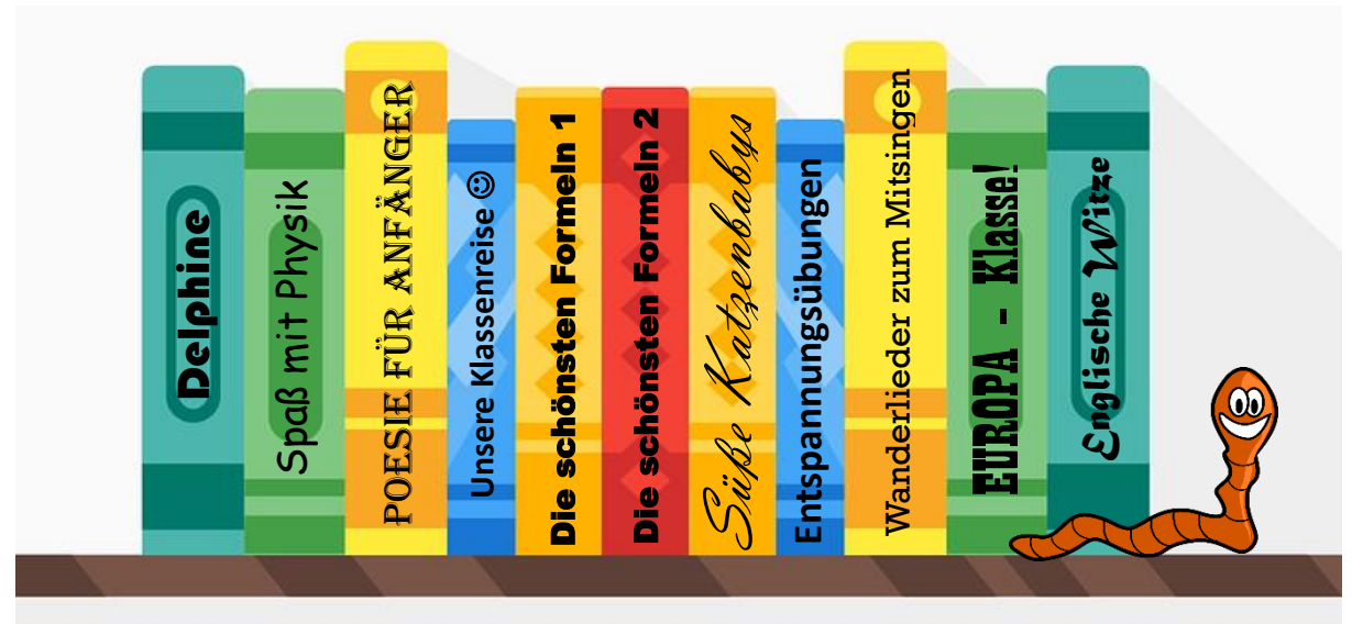
Die Größenverhältnisse der Abbildung sind nicht maßstabsgetreu.

Die Seiten sind in jedem Band zusammen 3cm dick. Jeder Buchdeckel hat eine Dicke von 2mm.